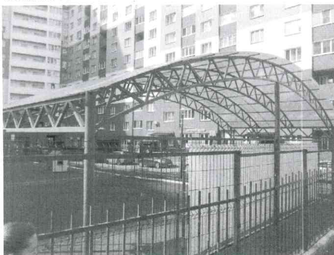
Фото № 11