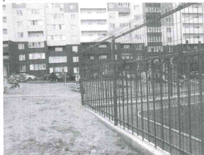
фото № 10