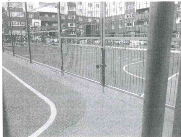
фото № 8