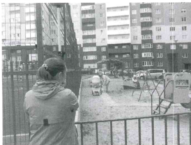
Фото № 9