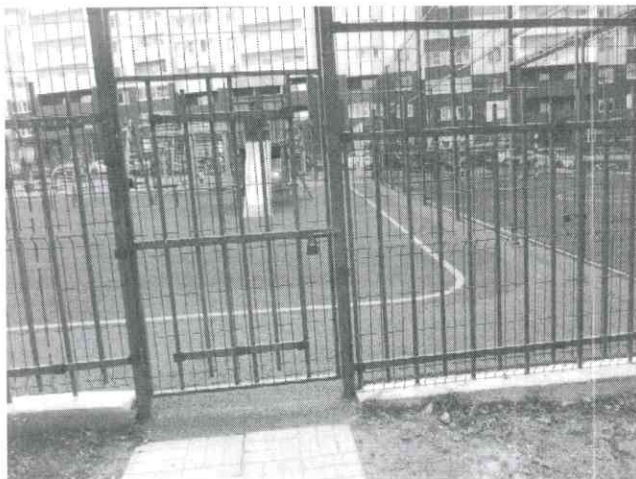
Фото № 7